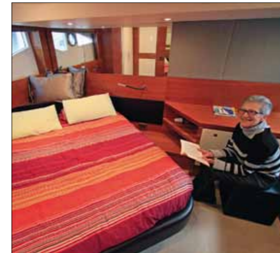
Les généreuses dimensions de la cabine propriétaires sont l'un des points forts du bateau.